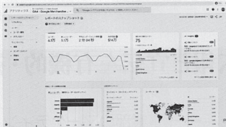
GA4版のデモアカウント画面

結論から申し上げますがGA4はこれまでのGAと比較して、得られるマーケティング情報としての価値は格段に上がると思います。マーケティングのトレンドも4P重視から4Cの顧客視点が重視される時代背景に、マッチしたサイト分析ツールです。従来のGAで何となく行われていた、ダッシュボードやペー